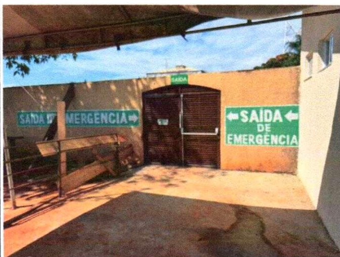
Saída de emergência sinalizada e com barra antipânico