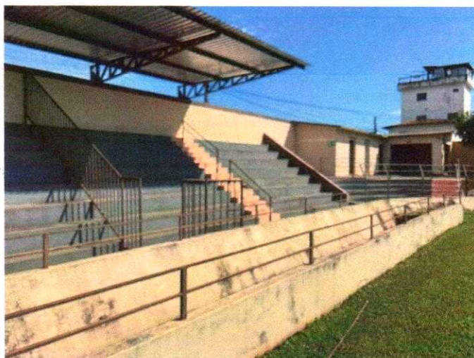
Arquibancada visitantes com separação física