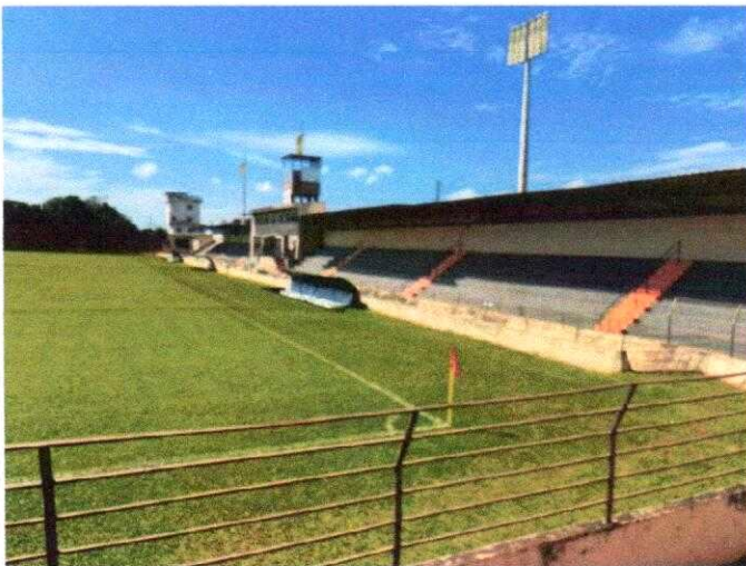
Arquibancadas cobertas e acessos radiais coloridos