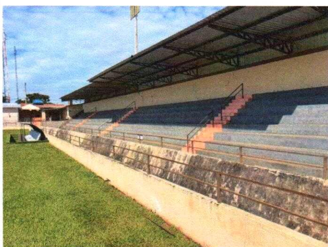
Arquibancada torcida local