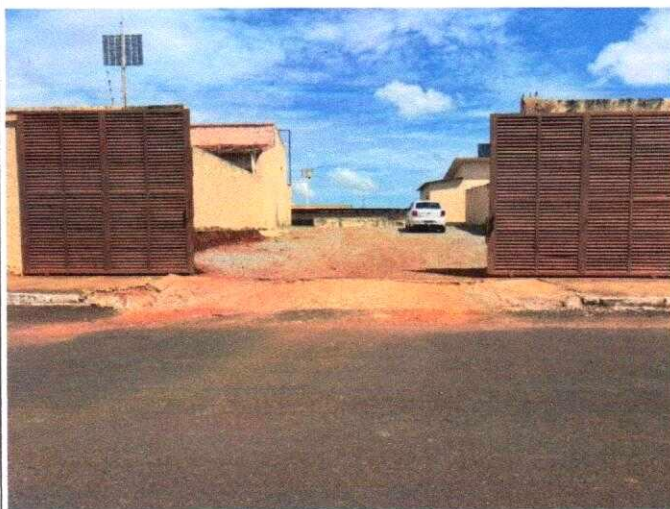
Acesso para ambulâncias e seguranças