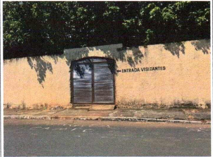
Acesso exclusivo para visitantes