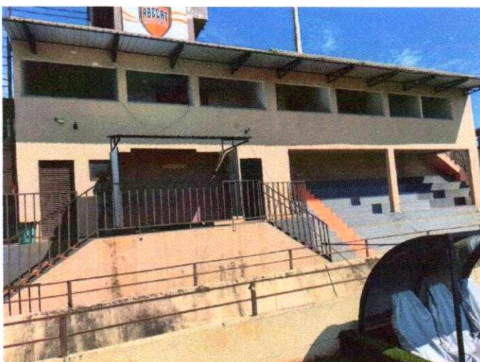
Cabines para imprensa