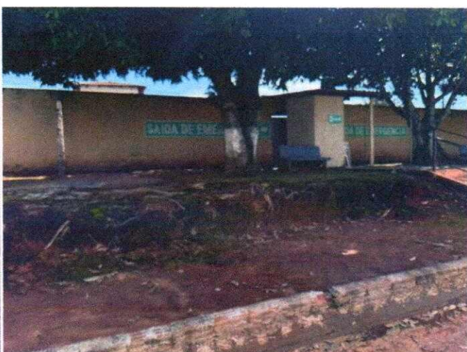
Saída de emergência sinalizada