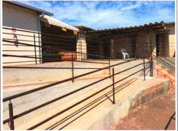
Rampa de acessibilidade